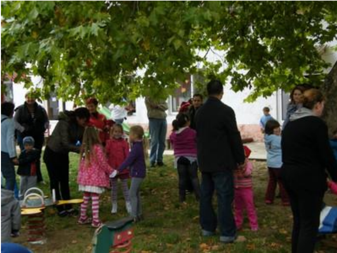
Őszköszöntő családi délután közös mozgással.

mely nem csak névleges, közös programokat is szervezünk. Az ő nagycsoportosaik szeptember végén óvodánk névadójának, Benedek Eleknek születésnapján jönnek hozzánk. Mi májusban Madarak és fák napján viszonzozzuk a látogatást. Hangulatos vidám délelőttöt töltünk el együtt. Ez azért is fontos, mivel egy iskolai osztályba fognak majd járni később, és ezzel is elősegítjük, hogy megismerjék egymást.